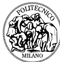
Politecnico di Milano